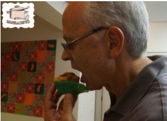
Marido devorando um Muffin quentinho!