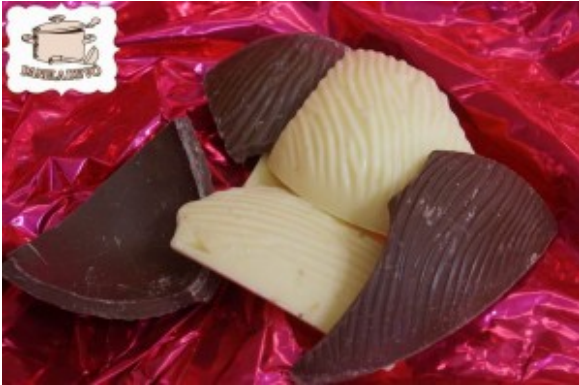
Sobras de Ovos de Páscoa!